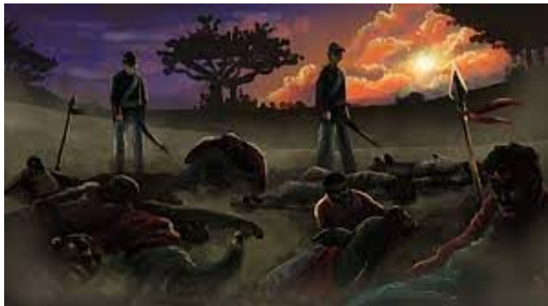
Massacre de Porongos

Recentemente, a Assembleia Legislativa do Rio Grande do Sul aprovou uma Proposta de Emenda à Constituição (PEC) para dificultar a alteração no hino sul-riograndense de um trecho racista: “Povo que não tem virtude acaba por ser escravo”. Como se escravizados fossem pessoas sem qualidades morais e, portanto, merecessem vegetar no cativeiro. Em última instância, a culpa pela escravidão seria da vítima, não do algoz. O raciocínio é perverso; a decisão dos deputados, idem. Maneira nada sutil de bloquear o debate sobre um genocídio que teima em persistir, na contemporaneidade.